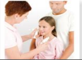
Erstes Instrument ansetzen