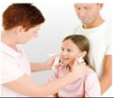
2tes Instrument ansetzen